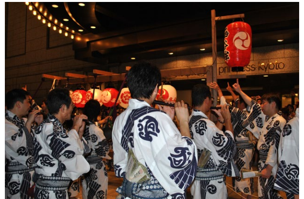
ホテル前にて祇園囃子

日時 7月16日 23:30 前後 (雨天中止) Date 16 July Time around 11:30 p.m. 場所 ホテル玄関 Vanue Hotel entrance 囃子方 函谷鉾 囃子方 Performer KANKO-BOKO Hayashikata