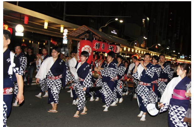
祇園囃子を演奏しながら練り歩きます

日時 7月16日 22:30 前後 (雨天中止) Date 16 July Time around 10:30 p.m. 場所 ホテル玄関 Vanue Hotel entrance 囃子方 綾傘鉦 囃子方 Performer AYAKASA-HOKO Hayashikata