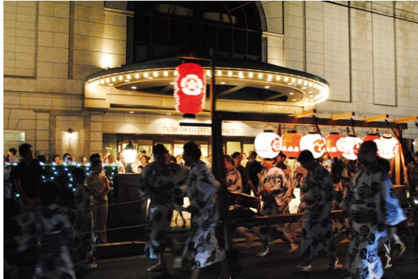
ホテル前高辻通を西進中