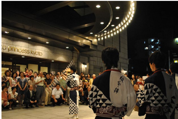
ホテル前にて綾傘鉦棒振り囃子