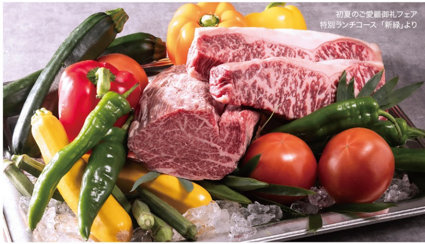
初夏のご愛顧御礼フェア 特別ランチコース「新緑」より