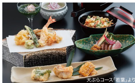
天ぷらコース「若葉」より