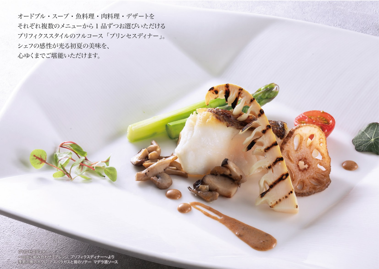
プリンセスディナー ～自由に組み合わせてアレンジ プリフィクスディナー～より 季節の魚のボワレ アスパラガスと茸のソテー マデラ酒ソース

オードブル・スープ・魚料理・肉料理・デザートをそれぞれ複数のメニューから1品ずつお選びいただけるプリフィクススタイルのフルコース「プリンセスディナー」。シェフの感性が光る初夏の美味を、心ゆくまでご堪能いただけます。