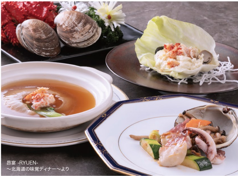
昂宴 -RYUEN- ～北海道の味覚ディナー～より

アワビとロブスターの旨みを引き出した華やかなランチと、花咲ガニや北寄貝、帆立貝など北海道の滋味豊かな食材を主役にした贅沢なディナー。広東料理をベースにアレンジした本格中国料理による、素材本来の持ち味を活かした美食の共演ぜひお楽しみください。