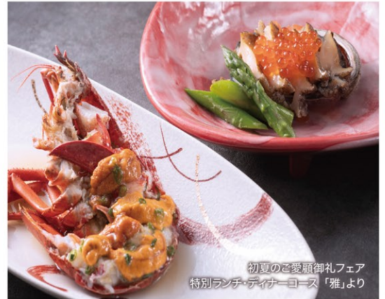
初夏のご愛顧御礼フェア 特別ランチ・ディナーコース「雅」より

黒毛和牛やオマール海老などの豪華食材を、シェフの鮮やかな手捌ぎで焼き上げます。香ばしい香りとダイナミックな音に包まれながら、五感に響く贅沢な時間を。