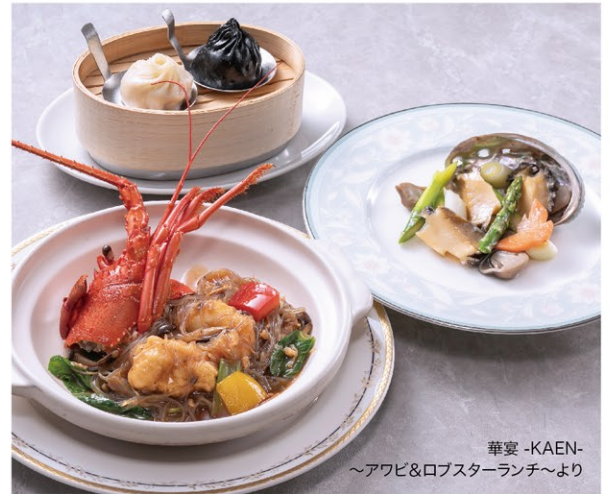
華宴 -KAEN- ～アワビ&ロブスターランチ～より

アワビとロブスターの旨みを引き出した華やかなランチと、花咲ガニや北寄貝、帆立貝など北海道の滋味豊かな食材を主役にした贅沢なディナー。広東料理をベースにアレンジした本格中国料理による、素材本来の持ち味を活かした美食の共演ぜひお楽しみください。