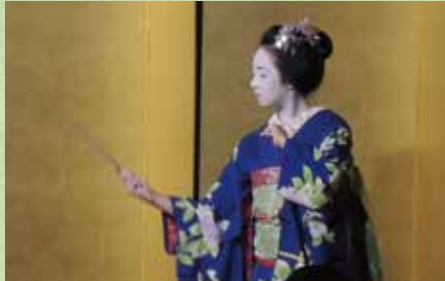
祇園甲部の舞妓による 艶やかな京舞