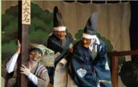
せんぼんえんまどうだいねんぶつきょうげん 千本糸んま堂大念佛狂言