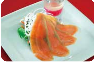
4 サーモンのサラダ NEW プリンセスチャイナドレッシング和え Salmon salad with princess china dressing