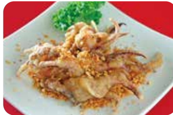
11 烏賊の天ぷら NEW スパイシーガーリックパウダー風味 Fried cuttlefish with spicy garlic powder