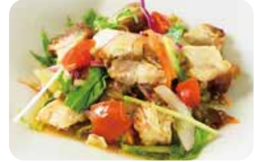
6 五目サラダ ピリ辛孝太郎黒酢和え Chop suey salad with spicy black vinegar