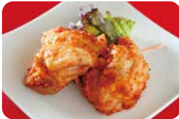
10 鶏の唐揚げ 豆板醤風味 NEW Deep-fried chicken with chili bean