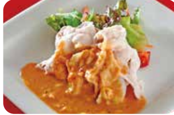
5 豚しゃぶのサラダ 胡麻ソース NEW Parboiled pork salad with sesame dressing