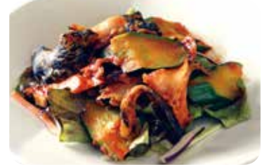
3 つぶ貝と胡瓜の コチュジャン和え Marinated whelk and cucumber with gochu-jang