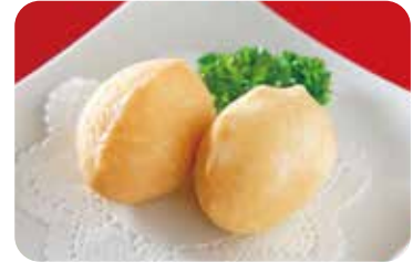
9 五目揚げ餅 NEW Deep-fried rice cake