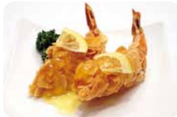
8 海老のアーモンド揚げ レモンソース Almond fried prawn with lemon sauce