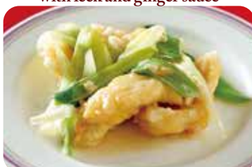
26 白身魚の葱生姜炒め NEW Sautéed white fish with leek and ginger sauce