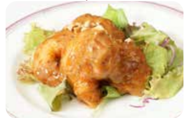
24 海老と烏賊の ブラックマヨネーズソース和え Fried prawns and cuttle fish in black pepper and mayonnaise sauce

卵・乳成分・小麦・落花生・えび / Egg・Milk・Wheat・Peanut・Shrimp