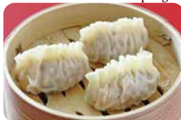
14 フカヒレ餃子 Steamed shark's fin dumplings