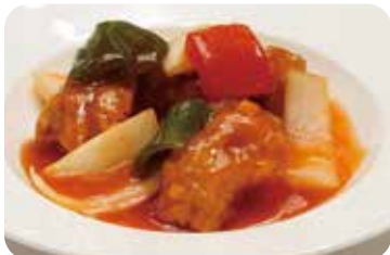
28 酢豚 Sautéed pork with sweet and sour sauce