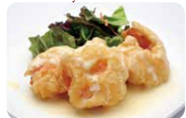
12 海老のマヨネーズ和え Deep-fried shrimp in mayonnaise sauce