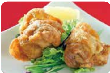
10 鶏の唐揚げ NEW Deep-fried chicken