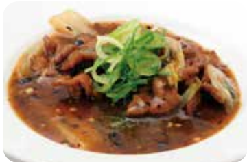
19 牛肉の四川風煮込み Braised beef szechuan style