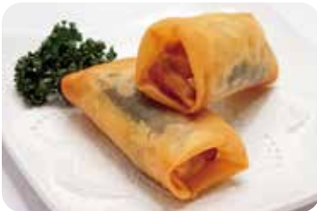
7 春巻 Crispy spring roll