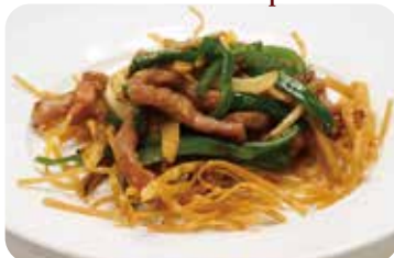
29 牛肉とピーマンの細切り炒め Sautéed shredded beef with in bean paste