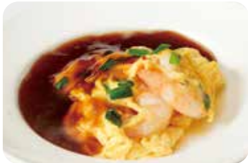
22 海老と蕪の玉子とじ 甘酢あんかけ Scrambled eggs with shrimp and Chinese chive in sweet and sour ankake sauce