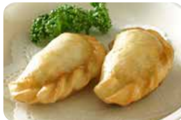
11 揚げ餃子 Fried dumpling