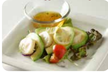
2 帆立貝柱とアボカドの りんご酢ドレッシング和え Marinated scallops and avocado with apple cider vinegar