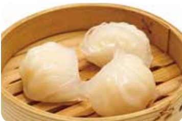
13 海老蒸し餃子 Steamed prawn dumplings