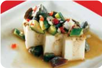
4 ピータン豆腐 NEW Presered eggs and tofu salad