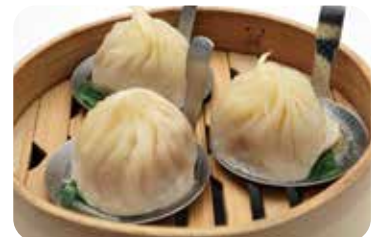
15 小籠包 Steamed bun with soup