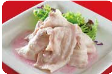
5 豚しゃぶのサラダ NEW オニオンドレッシング仕立て Parboiled pork salad with onion dressing