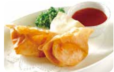
9 海老まるごとワンタン Deep-fried shrimp wonton