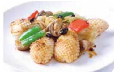
30 烏賊とレタスの ブラックビーンズ炒め Sautéed cuttle fish and lettuce with black bean