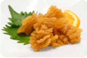
1 クラゲの和え物 Marinated jelly fish