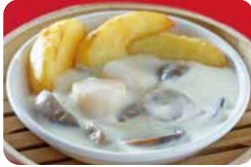
17 帆立貝柱と じゃがいものクリーム煮込み NEW Braised scallops and potatoes with cream sauce