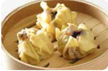
16 蛸焼売 Octopus shao-mai dumplings

*A-la-carte dim sum available (¥500 each)