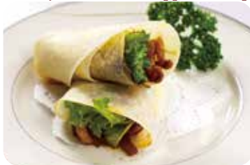
23 豚バラ肉の味噌炒め クレープ包み Sautéed pork with soybean sauce wrapped in crepe