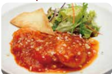
25 海老のチリソース煮込み Braised prawns in chilli sauce

卵・乳成分・小麦・落花生・えび / Egg・Milk・Wheat・Peanut・Shrimp