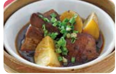
18 京のもち豚の 孝太郎黒酢煮込み Braised "KYO-NO MOCHIBUTA" pork with sweet and black vinegar sauce