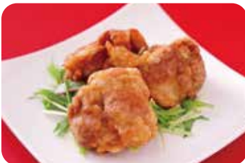
10 鶏の唐揚げ NEW Deep-fried chicken