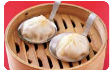
15 小籠包 Steamed bun with soup