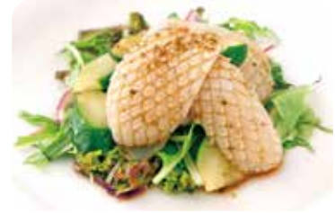
6 烏賊の山椒ソース和え NEW Marinated cuttlefish with japanese pepper sauce