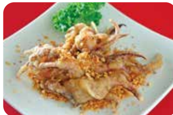
11 烏賊の天ぷら スパイシーガーリックパウダー風味 Fried cuttlefish with spicy garlic powder