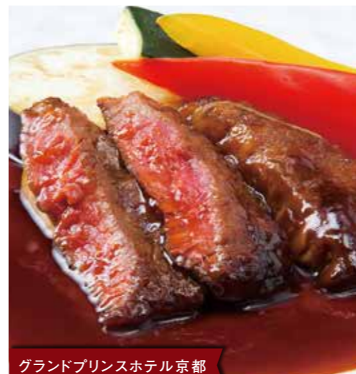
グランドプリンスホテル京都