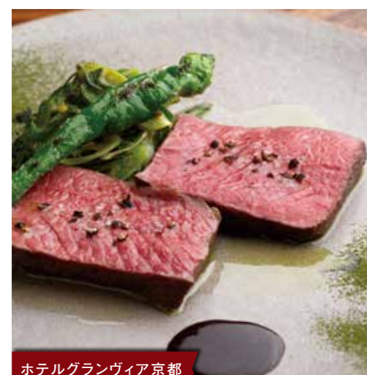
ホテルグランヴィア京都