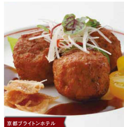
京都ブライトンホテル