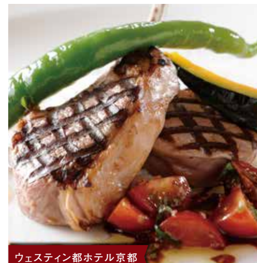
ウェスティン都ホテル京都