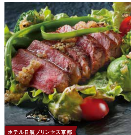
ホテル日航プリンセス京都