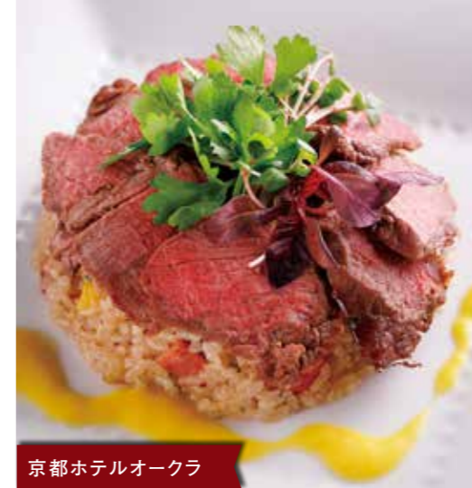
京都ホテルオークラ