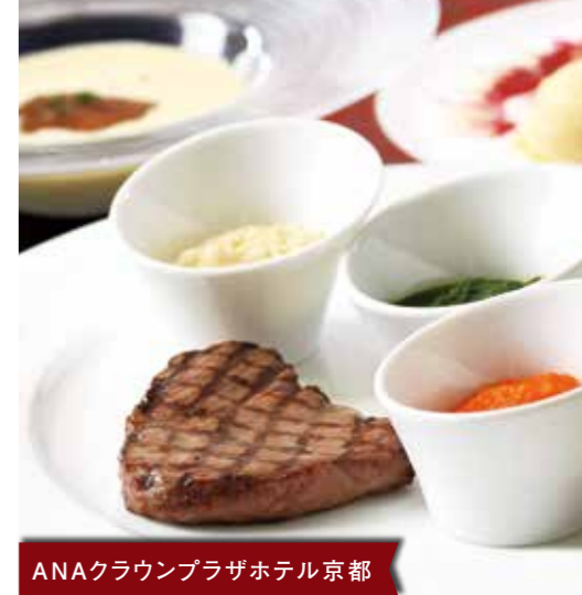
ANAクラウンプラザホテル京都