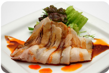
5 豚バラ肉の ガーリックソース Slightly boiled pork with garlic sauce