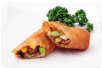
10 夏野菜春巻 NEW Crispy spring roll with summer vegetable