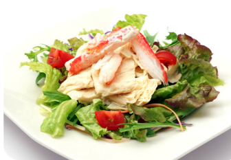
6 蟹肉と湯葉のサラダ NEW 白みそドレッシング Salad of crab meat and Yuba with white miso dressing