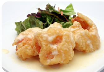
12 海老のマヨネーズソース和え Fried prawns in mayonnaise sauce