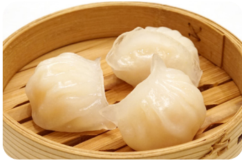
13 海老蒸し餃子 Steamed prawn dumplings