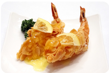
8 海老のアーモンド揚げ レモンソース Almond fried prawn with lemon sauce