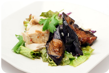
4 鶏肉と茄子のピリ辛冷菜 NEW Cold appetizer of chicken and egg plant with spicy sauce