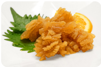
1 クラゲの和え物 Marinated jelly fish