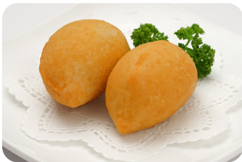
11 五目揚げ餅 Deep fried rice cake