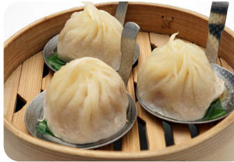
15 小籠包 Steamed bun with soup