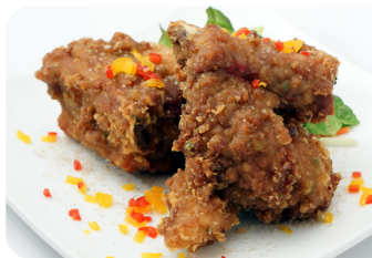
9 スペアリブの唐揚げ 山椒塩添え NEW Deep fried spareribs with Japanese pepper and salt