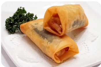
7 春巻 Crispy spring roll