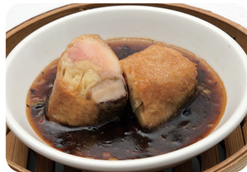
18 鶏肉と椎茸の湯葉巻き 豆鼓ソース NEW Chicken and Shiitake mushroom in Yuba roll with black beans sauce