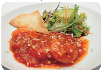
25 海老のチリソース煮込み Braised prawns in chilli sauce