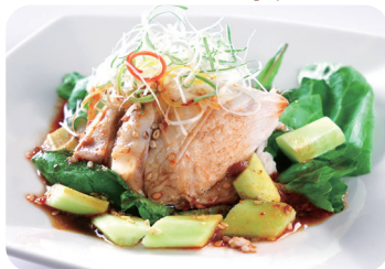
3 よだれ鶏のサラダ Salad of chicken with spicy sauce