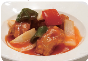
28 酢豚 Sautéed pork with sweet and sour sauce