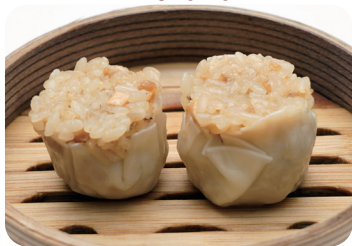
16 もち米焼売 NEW Shao-mai dumplings in glutinous rice