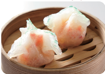
17 海鮮入り蒸し餃子 Steamed seafood dumplings