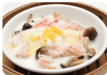
21 蟹肉と白菜の柚子薫る クリームソース煮込み NEW Braised crab meat and chinese cabbage with Yuzu flavor cream sauce