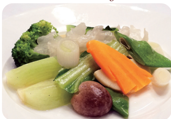
26 季節野菜の炒め Sautéed seasonal vegetables