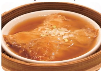
19 野菜湯葉巻きの オイスターソース蒸し Steamed vegetable Yuba roll with oyster sauce