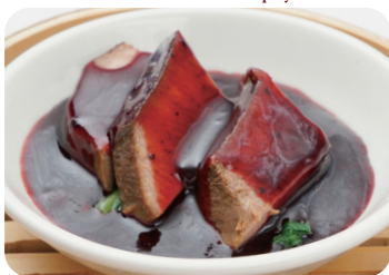
20 牛すね肉のピリ辛ソース蒸し Steamed beef shin with spicy sauce