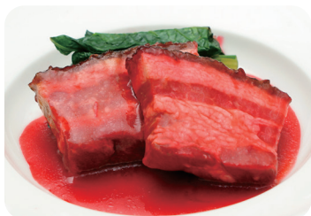
22 豚バラ肉の南乳煮込み NEW Braised belly pork with fermented bean sauce