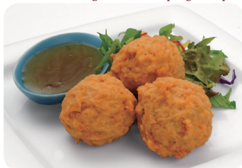
9 軟骨入り鶏肉団子の揚げ物 プラムソース Fried chicken gristle ball dumplings with plum sauce