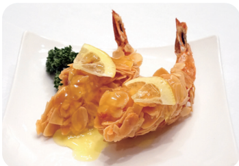
8 海老のアーモンド揚げ レモンソース Almond fried prawn with lemon sauce