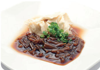
5 竹湯葉のなめ茸がけ Braised YUBA with ENOKI mushroom sauce