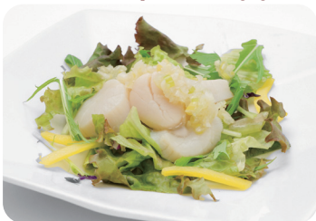
2 帆立貝柱の葱生姜ソース Marinated scallops with leek and ginger sauce