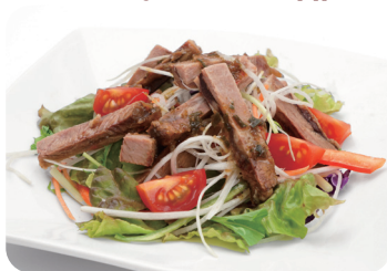
6 牛タンのサラダ 山椒ソースがけ Salad of tongue of beef with chinese pepper sauce