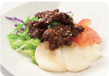
4 牛肉とモッツァレラチーズの和え物 Dressed deep-fried beef and mozzarella cheese