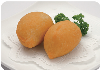
11 五目揚げ餅 Deep fried rice cake