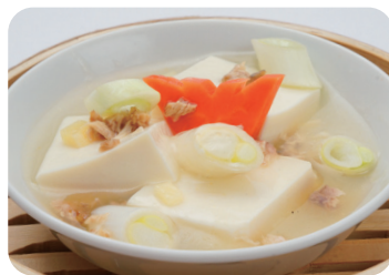
干し魚の塩漬けと豆腐の蒸し物 Steamed dried fish and tofu with salt