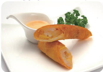
10 海老春巻きチリマヨソース添え Shrimp spring rolls with chill and mayonnaise sauce