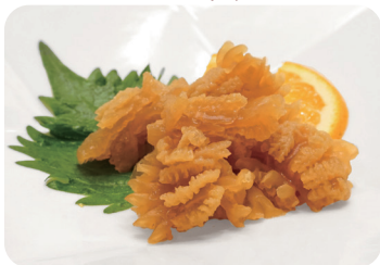
1 クラゲの和え物 Marinated jelly fish