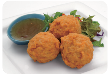
9 軟骨入り鶏肉団子の揚げ物 プラムソース NEW Fried chicken gristle ball dumplings with plum sauce