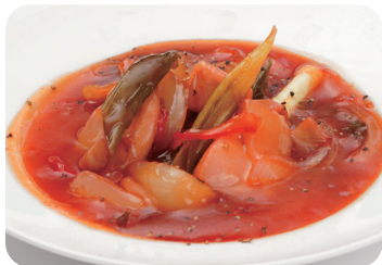
鶏肉と青葱の甘酢炒め NEW Sautéed chicken and green onions with sweet and sour sauce