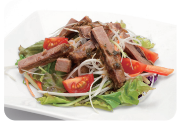
6 牛タンサラダ 山椒ソースがけ NEW Salad of tongue of beef with chinese pepper sauce