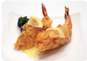
8 海老のアーモンド揚げ レモンソース Almond fried prawn with lemon sauce