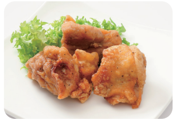
12 鶏肉のスパイシー唐揚げ Spicy deep-fried chicken