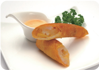
10 海老春巻きチリマヨソース添え NEW Shrimp spring rolls with chill and mayonnaise sauce