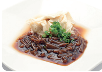
5 竹湯葉のなめ茸がけ Braised YUBA with ENOKI mushroom sauce