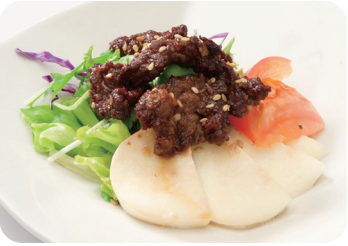
4 牛肉とモッツァレラチーズの和え物 Dressed deep-fried beef and mozzarella cheese