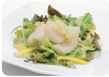
2 帆立貝柱の葱生姜ソース NEW Marinated scallops with leek and ginger sauce