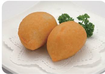
11 五目揚げ餅 NEW Deep fried rice cake