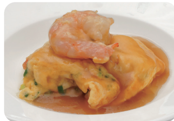
海老と玉子のふわとろ炒め NEW あんかけ仕立て Scranned egg and shrimp with thick starchy sauce