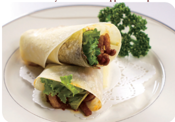
豚バラ肉の味噌炒め クレープ包み Sautéed pork with soybean sauce wrapped in crepe