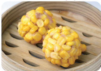
コーン焼売 Steamed corn dumplings