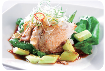
3 よだれ鶏のサラダ Salad of chicken with spicy sauce