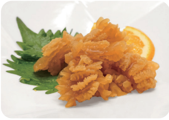
1 クラゲの和え物 Marinated jelly fish