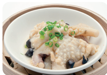
烏賊の塩麴蒸し Steamed cuttlefish with malt