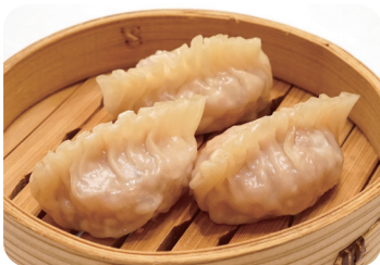
14 フカヒレ餃子 Steamed shark's fin dumplings