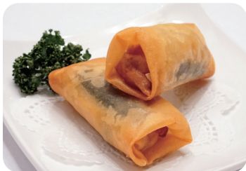
7 春巻 Crispy spring roll