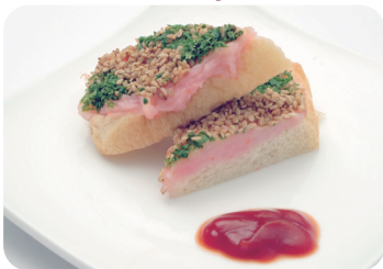
11 海老のすり身のトースト揚げ NEW Fried minced prawn on toast