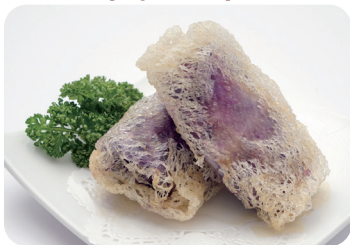
10 里芋の春巻き NEW Spring roll of taro potato