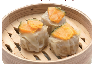
南瓜焼売 Steamed pumpkin dumpling