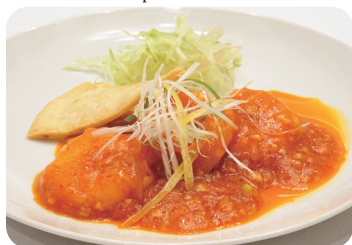
海老のチリソース Braised prawns in chilli sauce