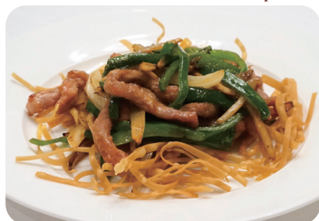
牛肉とピーマンの細切り炒め Sautéed shredded beef with in bean paste