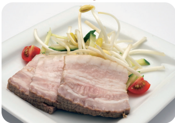
2 豆もやしとベーコンの和え物 NEW Marinated bean sprouts and bacon