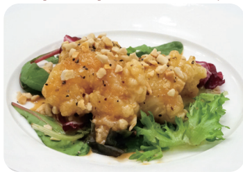
6 海老と烏賊の衣揚げ ブラックマヨネーズ和え Deep-fried shrimp and cuttlefish with black mayonnaise