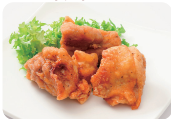
12 鶏肉のスパイシー唐揚げ Spicy deep-fried chicken