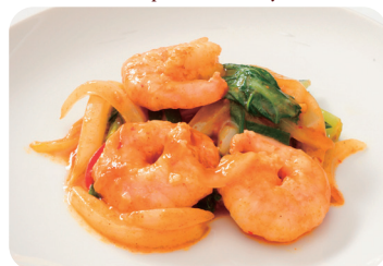
海老のカレーソース炒め Sautéed prawns with curry sauce