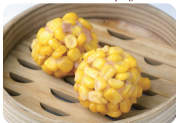
コーン焼売 Steamed corn dumplings