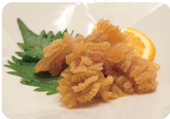
1 クラゲの和え物 Marinated jelly fish