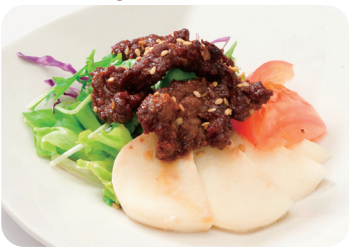
4 牛肉とモッツァレラチーズの 和え物 Dressed deep-fried beef and mozzarella cheese