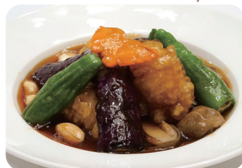
烏賊の醤油チリ煮込み Braised cuttlefish with chilli and soy sauce