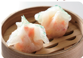
海鮮入り蒸し餃子 Steamed seafood dumplings