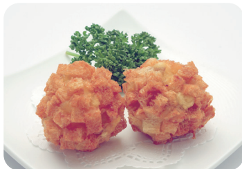
9 鹿の子風ピリ辛ポテトコロッケ NEW Spicy deep-fried potato croquette