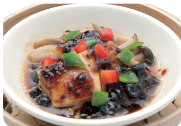
鶏肉とキノコの豆鼓蒸し Steamed chicken and mushroom with black beans sauce