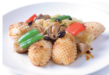
烏賊とレタスの ブラックビーンズ炒め Sautéed cuttlefish and lettuce with black bean

※上記料金には 10%のサービス料および税金が含まれております。 ※食材の都合により内容が一部変更になる場合がございます。 ※写真はイメージです。