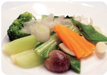
季節野菜の炒め Sautéed seasonal vegetables