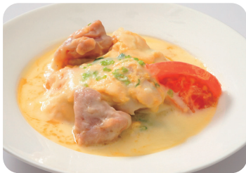
鶏肉と玉子のチーズ炒め NEW Sautéed chicken and egg with cheese