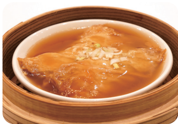
野菜湯葉巻のオイスターソース Steamed vegetable Yuba roll with oystersauce