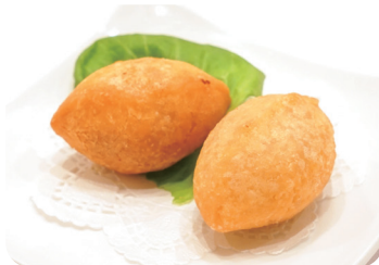
9 五目揚げ餅 Deep fried rice cakes