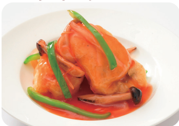
11 鱧の天ぷら 甘酢あんかけ NEW Deep-fried pike conger with sweet and sour sauce