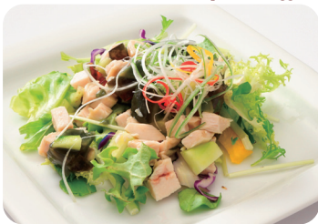
2 蒸し鶏とピータンのサラダ NEW Salad of steamed chicken and preserved eggs