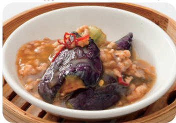
茄子とひき肉のあんかけ NEW Fried egg plant with minced meat with starchy sauce