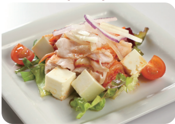
5 豚しゃぶと豆腐のサラダ Salad of parboiled pork and tofu