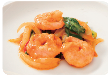
海老のカレーソース炒め NEW Sautéed prawns with curry sauce