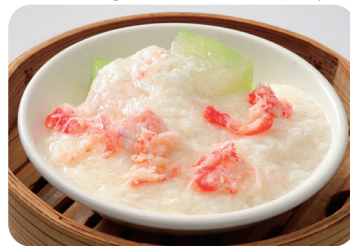
冬瓜の蟹肉あんかけ NEW Fried wax gourd and crab meat with starchy sauce