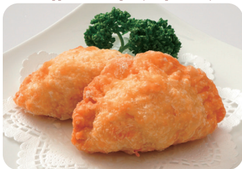
10 五目入り網脂包み揚げ NEW Wrapped fried chop suey crepinette style