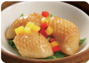
烏賊のサテースソース蒸し Steamed cuttlefish with satay sauce