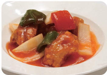
酢豚 Sautéed pork with sweet and sour sauce