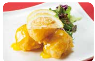
12 帆立貝柱の衣揚げ レモンソース Deep fried scallops with lemon sauce