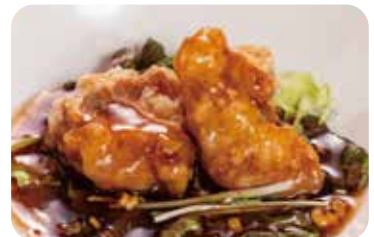
9 鶏肉の唐揚げ 黒酢ソース Deep-fried chicken with black vinegar sauce