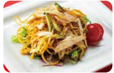
3 蒸し鶏と干し豆腐の和え物 Steamed chicken and dried tofu