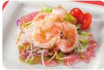
2 海老のサラダ プリンセスチャイナドレッシング Shrimps salad with princess china dressing