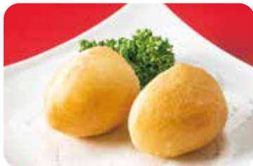
7 五目揚げ餅 NEW Deep-fried rice cake