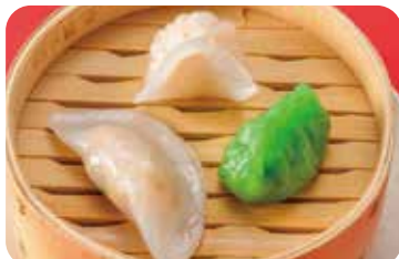
13 点心三種盛り合わせ (五目蒸し餃子・海老蒸し餃子・翡翠餃子) Assorted steamed dumplings