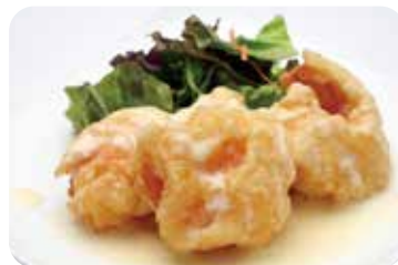
11 海老の フルーツマヨネーズソース Deep-fried shrimp in fruits mayonnaise sauce