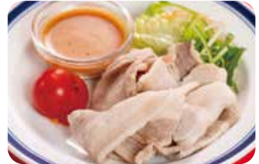
6 豚肉の湯引き フルーツ豆板醤と胡麻ソース Boiled pork salad with bean sauce and sesame sauce