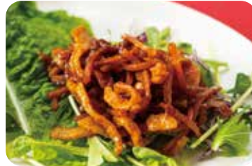
5 豚バラ肉の味噌和え サラダ添え NEW Sautéed pork belly in miso paste with salad