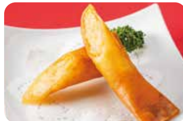
8 海老春巻 NEW Shrimps spring roll