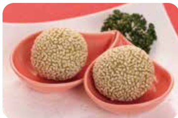
10 抹茶餡の胡麻揚げ団子 Fried sesame balls with green tea paste