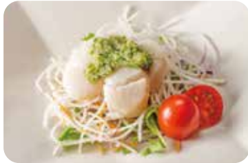
4 帆立貝柱の葱生姜和え Steamed scallops with leek and ginger sauce