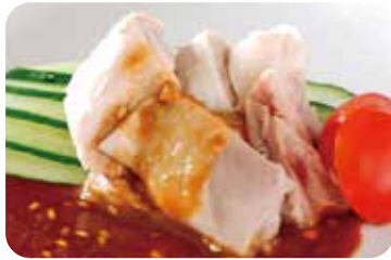
1 よだれ鶏 Steamed chicken with spicy sauce